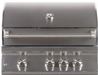
TAHUNA 3 Barbacoa de gas con 3 quemadores.

62,9cm (altura) x 71cm (anchura) x 53,3cm (profundidad)