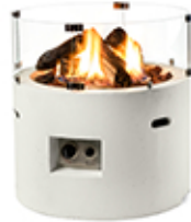
Mesa redonda blanca 61x61x42cm ref. SRR6501W