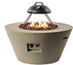
Mesa cone antracita 96x96x46cm ref. SRR6507Z