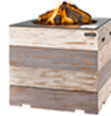
Mesa cuadrada Nice&Nasty 76x76x46cm ref. NN6504Z