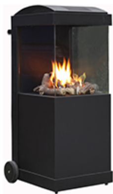
1388mm (alto) x 502mm (ancho) x 620mm (profundo)

TheBUZZ es una estufa de exterior móvil que funciona con gas con un diseño minimalista. En la terraza o en el jardín de casa, en la terraza de un restaurante, nos permitirá una placentera estancia en los días más fríos. TheBUZZ está disponible en metal negro o en acero corten.