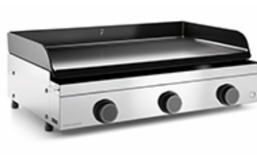
Origin G75 I Plancha Origin Gas 75 Inox