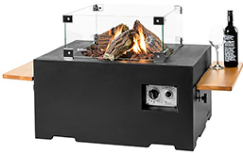
Mesa rectangular negra 80x60x40cm ref. SRS4005Z

Las mesas Happy Cocooning nos acercan la calidez y el ambiente del fuego para compartirlo en espacios exteriores, jardines o terrazas.