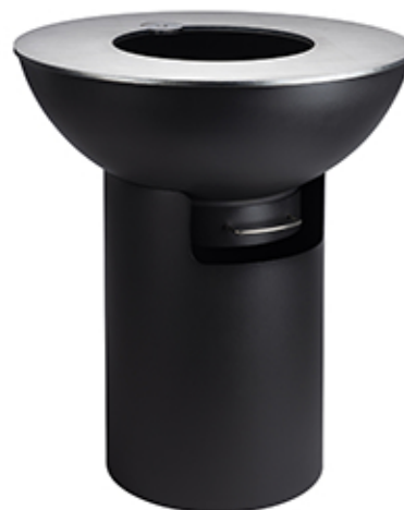
fiQ XL Acero negra