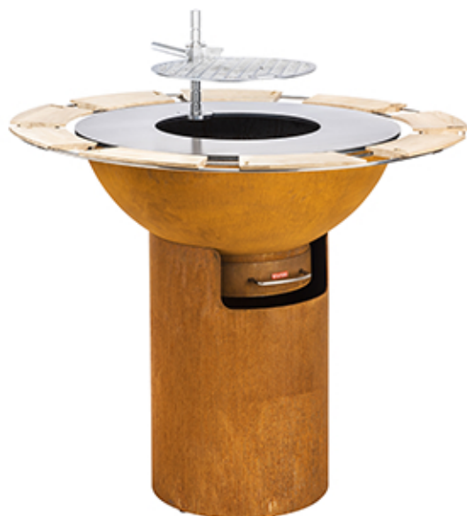
Kit Hospitality XL