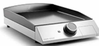
Domestic Plancha Domestic de acero inoxidable