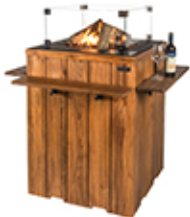
Mesa bar Teak 76x76x100cm ref. SRS6504HTSZ