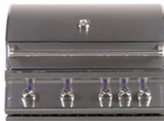
TAHUNA 4 Barbacoa de gas con 3 quemadores.

62,9cm (altura) x 71cm (anchura) x 53,3cm (profundidad)