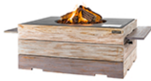
Mesa rectangular Nice&Nasty 107x80x46cm ref. NN6510Z