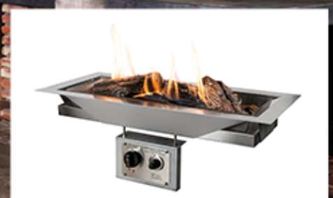
Quegador cuadrado grande HC 48x48x24cm integrado en mesa de Teka