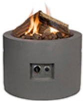
Mesa redonda negra 61x61x42cm ref. SRR6501T

Las mesas HC nos ofrecen la sensación de un fuego acogedor, sin el inconveniente de una estufa de leña. Fabricadas con un compuesto muy resistente para ofrecer la máxima durabilidad en la intemperie.