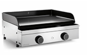
Origin G60 I Plancha Origin Gas 60 Inox