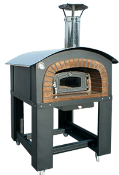
Horno de leña PANAMA

45 años después, los hornos DiFiore se han vuelto sinónimo de calidad, apreciados en todo el mundo, dan a conocer la genuinidad de la verdadera pizza italiana cocida con el horno de leña.