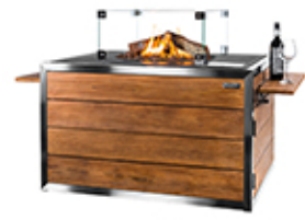
Mesa rectangular Lounge&Dining 110x80x67,5cm ref. LD-SSTH6510Z