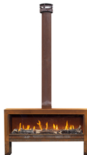
2238mm (alto) x 1260mm (ancho) x 311mm (profundo)