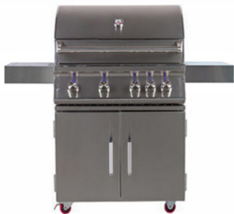
TAHUNA 3C Barbacoa de gas con 3 quemadores.

62,9cm (altura) x 71cm (anchura) x 53,3cm (profundidad)