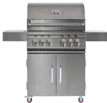
TAHUNA 4C Barbacoa de gas con 4 quemadores.

128,5cm (altura) x 143cm (anchura) x 70,9cm (profundidad)