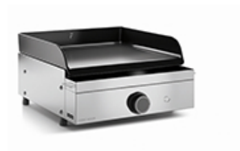
Origin G45 I Plancha Origin Gas 45 Inox