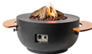
Mesa bowl negra 91x91x46cm ref. SRR6507Z